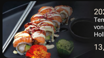
202. Fantasy Roll Tempura Garnele mit Avocado umhüllt von Lachs Sashimi und Hollandaise-Hoisin-Sauce