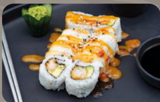
127. Rahimis Roll 1,2,3,4 Tempura Garnele mit Avocado, Mango-Curry-Sweet-Chili Sauce und geröstetem Sesam