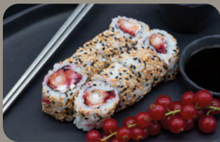
123. Berry 1,4,9 Tempura Garnele mit Frischkäse und Preiselbeeren