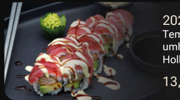
202a. Fantasy Roll Tempura Garnele mit Avocado umhüllt von Thunfisch Sashimi und Hollandaise-Hoisin-Sauce