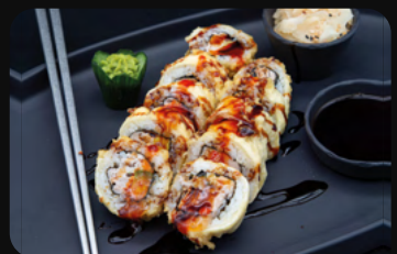
221. Maguro Big Roll Thunfisch mit Avocado