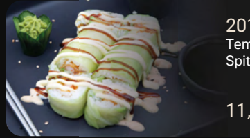
201. Season Soll Tempura Garnele mit Avocado, Spitzkohl und Hollandaise-Hoisin-Sauce