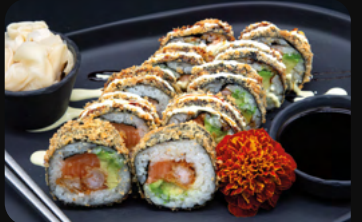
223. Crispy Scampi Big Roll Tempura Garnele mit Lachs, Avocado, Wasabi-Mayo und Teriyaki