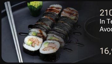
210. Big Duck Roll In Teriyaki gebratene Entenbrust mit Avocado und Teriyaki Sauce

Eine Riesenrolle in 10 Stück geschnitten