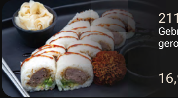
211. White Big Duck Roll Gebratene Entenbrust in Reisblätter gerollt mit Avocado und Teriyaki Sauce