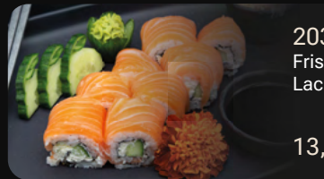
203. Salmon Delight Frischkäse und Gurke umhüllt von Lachs Sashimi