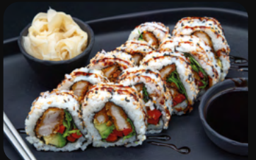
222. Crispy Chicken Big Roll Crispy Chicken mit roter Paprika, Rucola, Avocado und Teriyaki