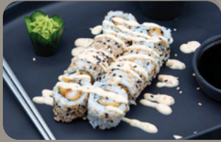
121. Spezial 1,4 Tempura Garnele mit Spezialsauce