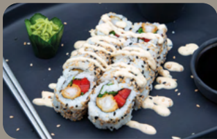
122. Queen 1,4,9 Tempura Garnele mit Rucola, Paprika und Spezialsauce