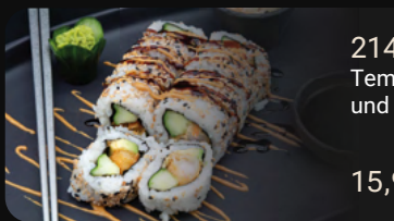
214. Big Crazy Nuts 1, 4 Tempura Garnele mit Gurke, Avocado und einer leicht scharfen Erdnussauce