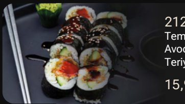
212. Tempura Ebi Dream Roll 1, 4, 8, 9 Tempura Garnele mit Röstzwiebeln, Avocado, Gurke, Basilikumpesto und Teriyaki Sauce