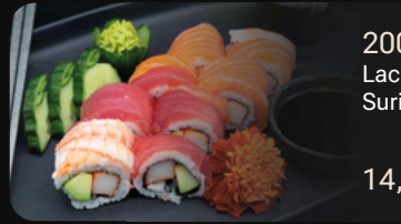
200. Rainbow Roll Lachs mit Thunfisch, Garnelen, Surimi und Avocado

Unsere Spezialrollen in 8 Stücke geschnitten