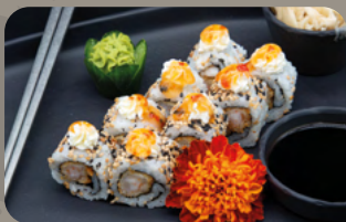
125. Cheese Dream 1,4 Tempura Garnele mit Frischkäse und Sweet-Chili-Sauce