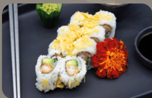
126. Truffle Dream 1,4 Tempura Garnele mit Avocado und crunchy Trüffelchips