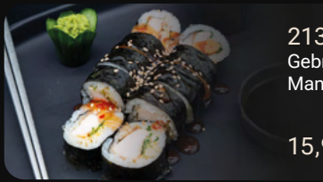
213. Crazy Chicken Roll 1, 2, 3, 9 Gebratene Hähnchenbrust mit Koriander, Mango-Curry und Sweet-Chili-Sauce