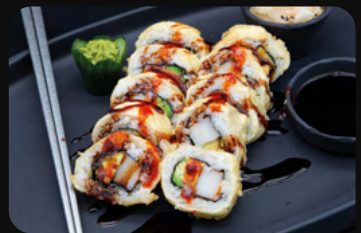
220. Surimi Big Roll Surimi (Krebsfleisch) mit Avocado

Eine in Tempura warme, frittierte Riesenrolle in 10 Stücke geschnitten