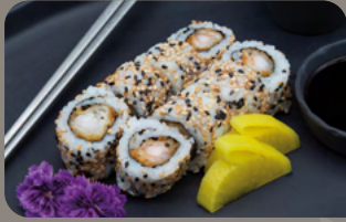
120. Exotic 1,4 Tempura Garnele mit Mango Chutney

Tempura Garnelen in verschiedenen Variationen. Alle Rollen werden mit hausgemachter Teriyaki Sauce serviert.