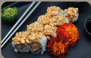
124. Crash Nuts 1,4 Tempura Garnele mit Mango Chutney und Erdnusstopping